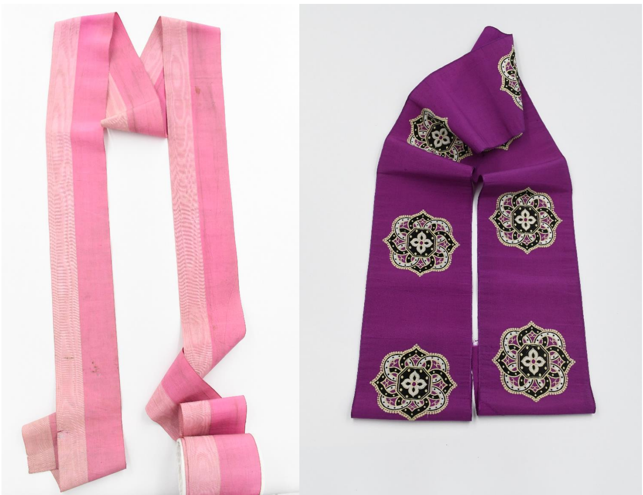
To silkebånd fra Museum Amagers samling. Det ene med moiré-arbejde og det andet med indiskinspireret medaljonudsmykning.