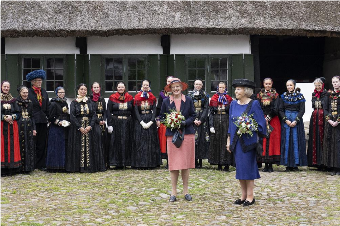
HM Dronning Margrethe 2. af Danmark og HKH Prinsesse Beatrix af Nederlandene ved den dobbelte jubilæumsfest på Museum Amager i 2022 med lokale iført amagerdragter delvist udlånt fra museets samling.

Museum Amagers samling af mere end 400 silkebånd indgår bl.a. i museets dragtudstilling om amagerbønderne/hollænderbønderne, i den pædagogiske samling, hvor de er en del af formidlingen til skolebørn, andre er på magasin. Silkebåndene på Museum Amager benyttes fortsat ved særlige lejligheder af de lokale, da få fortsat har hele dragter og må låne dele fra museet. I forbindelse med 400-års jubilæet i 1921, for hollænders ankomst, blev de fremmødte journalister imponerede over de egnsdragterne, som de mange lokale var klædt i. Til fællesjubilæet i 2022, for både Amagermuseets fødselsdag og 500 året for hollændernes ankomst til Amager, hvor Dronning Margrethe 2. og den tidligere Dronning Beatrix besøgte Amagermuseet, var over 50 voksne og børn i dragt.